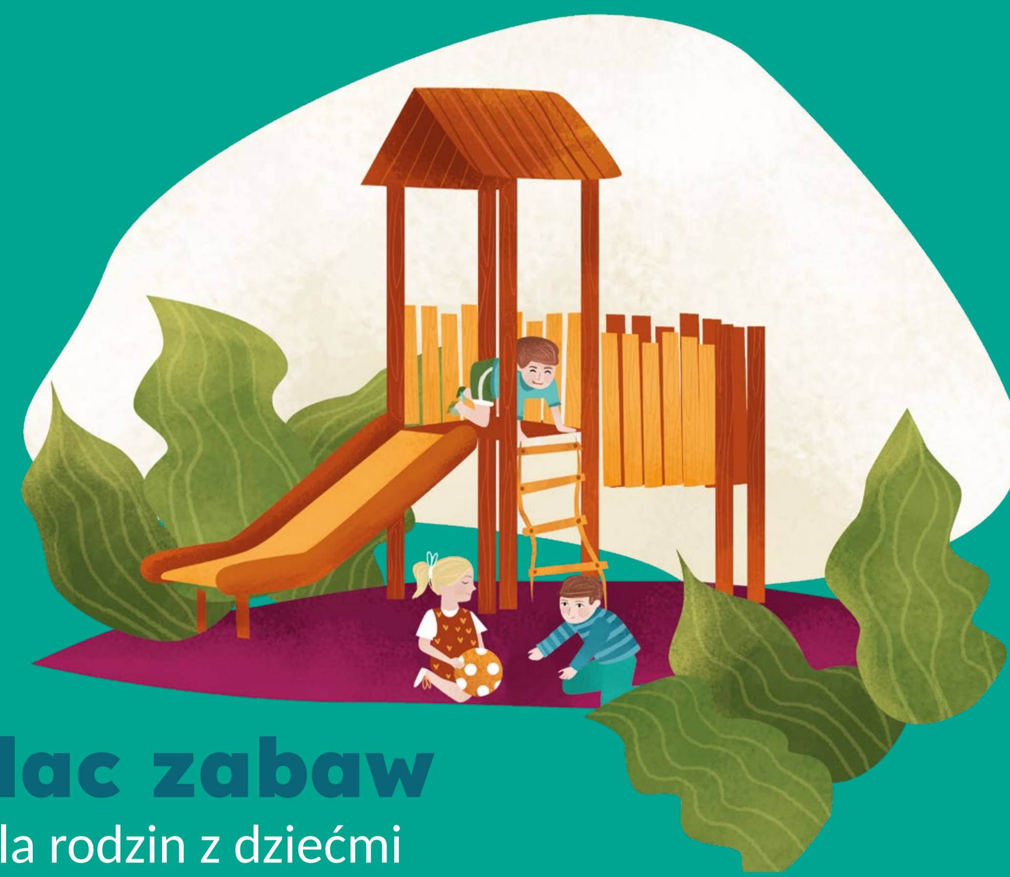
Plac zabaw dla rodzin z dziećmi