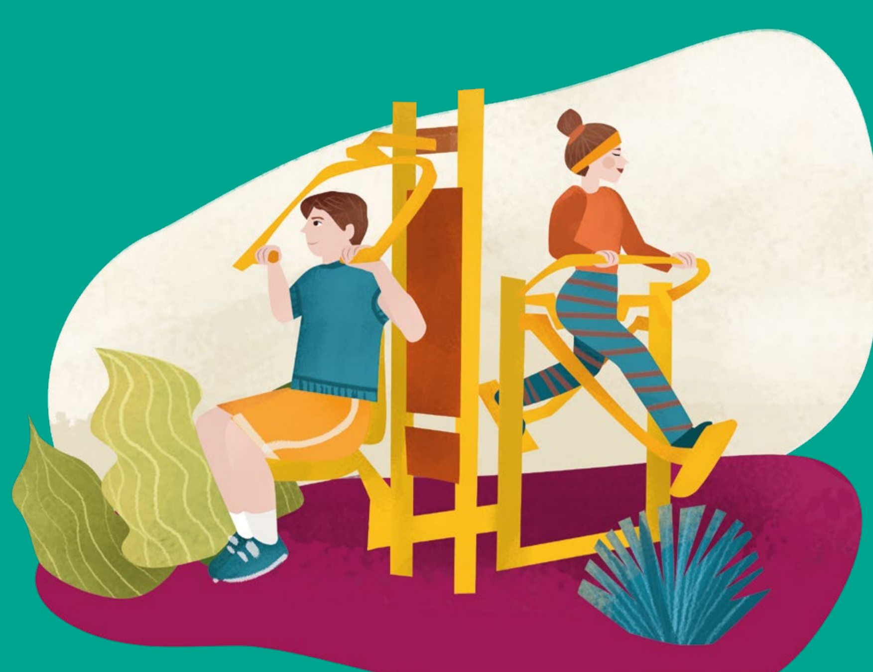
Siłownia terenowa trening bez wydawania pieniędzy