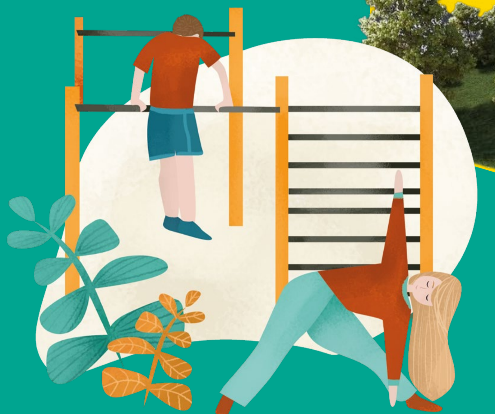
Kalistenika i Street Workout ćwiczenia na świeżym powietrzu