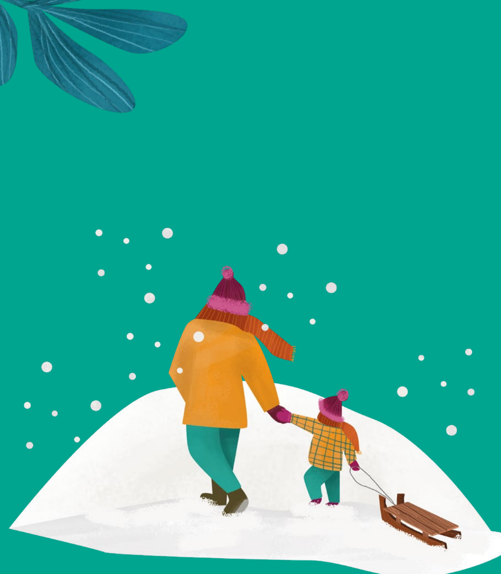
Górka saneczkowa zimowa atrakcja dla najmłodszych