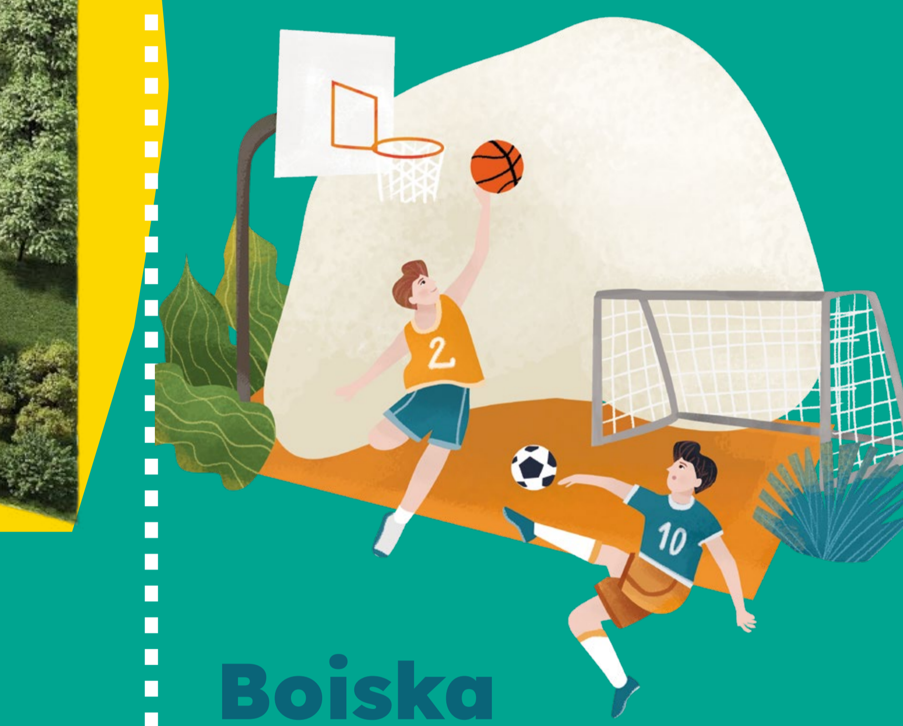
Boiska wielofunkcyjne od piłki nożnej po koszykówkę