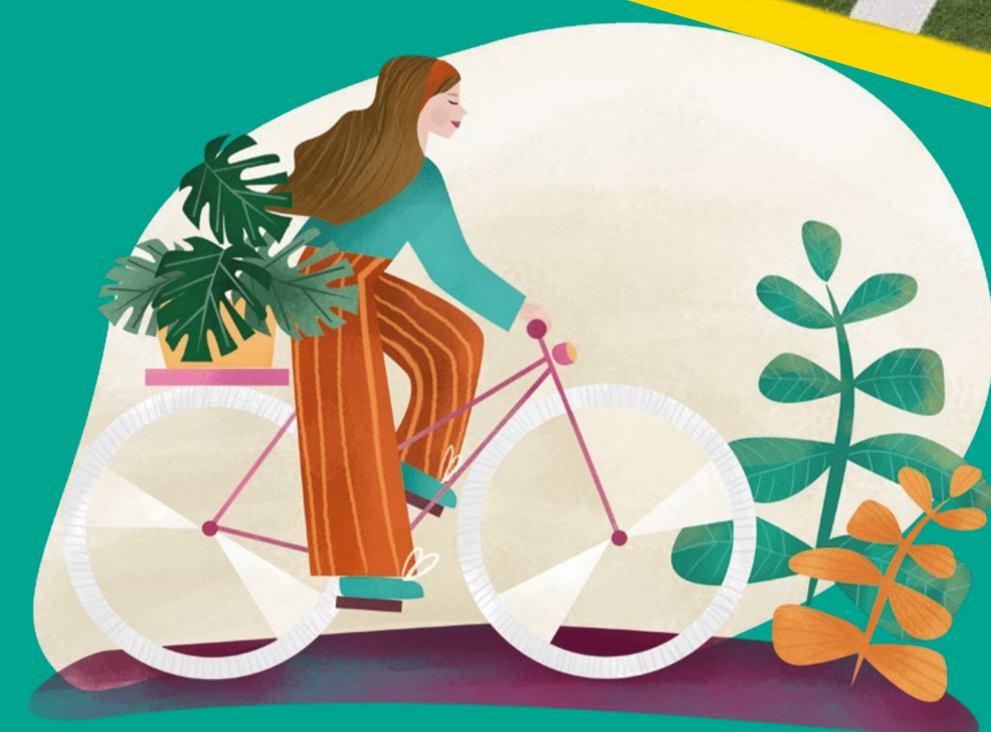
Trasa biegowa, Trasa rowerowa, Ścieżka zdrowia zażywajmy ruchu przy każdej okazji