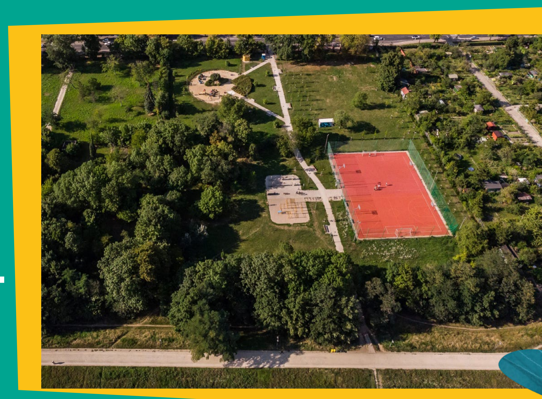
zdjęcie 2022 r.

Ponad 100-letnia ciągłość zachowania funkcji Polany Karłowickiej, jako przestrzeni rekreacyjnej.