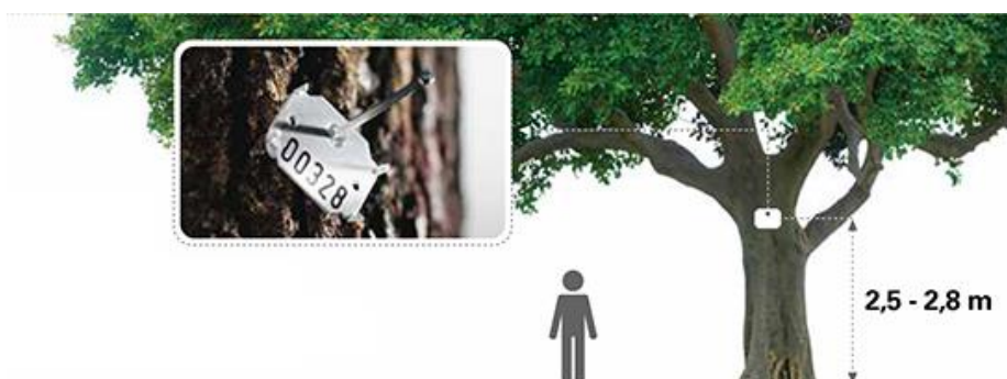
Fot 2. Umieszczenie arbotagu.

Tagowanie drzewa nie może wpłynąć negatywnie na jego stan zdrowotny/kondycję.