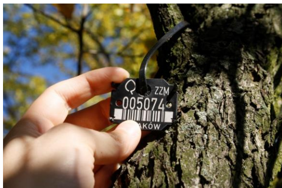
Fot 3. Sposób montażu nr ARBOTAG na nowych nasadzeniach, właściwy „luz” uwzględniający przyrost.

Drzewa o średnicy pnia do 10 cm (obwodzie pnia do 32 cm, mierzonym na wysokości 130 cm) należy oznaczać za pomocą etykiet przymocowanych do opasek zaciskowych w kolorze czarnym (opaska o długości 30 - 37cm i szerokości 4,8cm, odporne na UV) poprzez przymocowanie do bocznej gałęzi z zachowaniem odpowiedniego luzu uwzględniającego przyrost drzewa. Arbotag wraz z opaską powinien znajdować się na wysokości 2,5-2,8 m, od strony północnej (zalecane). Do zawieszenia opaski należy wybrać główne pędy szkieletowe (silne i zdrowe), aby ograniczyć ryzyko, że opaska z arbotagiem zostanie usunięta podczas zabiegów pielęgnacyjnych. Sposób montażu nie może wpływać na prawidłowy wzrost drzewa. Dopuszcza się oznaczanie drzew już posadzonych poprzez zawieszenie etykiet na pierwszych dostępnych gałęziach korony (na wysokości minimum 2,2m).